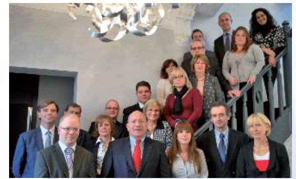
La famille PATRIMONIA est heureuse de vous accueillir dans cette ancienne demeure rénovée Patrimonia House 104 Chée de Bruxelles 1410 Waterloo

+32.2.351 51 00 www.patrimonia.be info@patrimonia.be